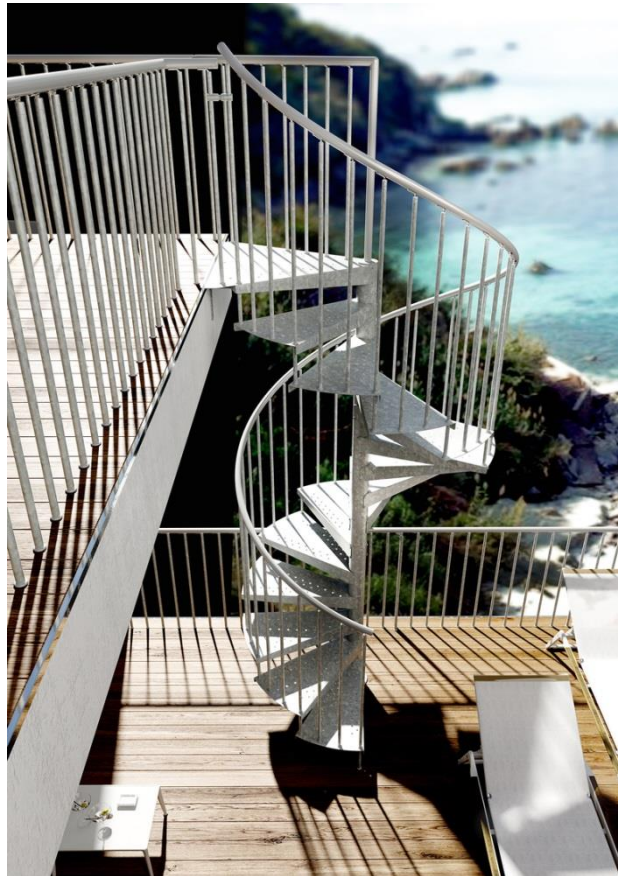
Wenteltrap Type "Firenze Zink"